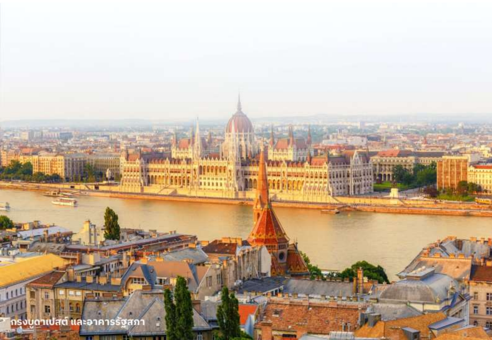
กรุงบูดาเปสต์ และอาคารรัฐสภา

นำท่านเข้าสู่ที่พัก Park Inn By Radisson Budapest หรือเทียบเท่า