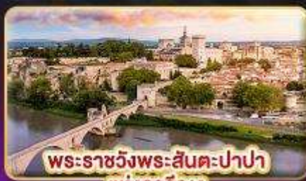
พระราชวังพระสันตะปาปา แห่งอเวียง