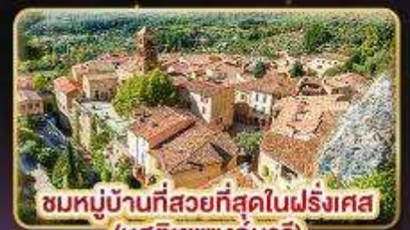
ชมหมู่บ้านที่สวยงามที่สุดในฝรั่งเศส (มูสติเยแซงก์มารี)