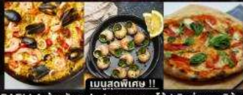
PAELLA ข้าวผัดสเปน / หอยเสกใส่ / พิซซ่ามากริตต้า