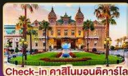
Check-in คาสีโนมอนติคาร์โล