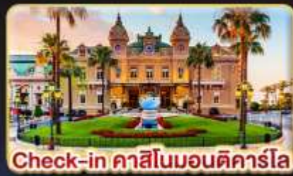
Check-in คาสิโนมอนติคาร์โล