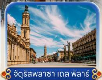
จัตุรัสพลาซ่า เดล พาร์