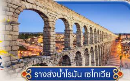
รางส่งน้ำโรมัน เซโกเวีย

สายการบินสัญชาติสเปน ✕ บินตรง Full Service