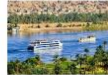
พักผ่อนตามอัธยาศัยบนเรือสำราญ

** พักที่ Royal Beau Rivage Nile cruise 5* หรือเทียบเท่า **