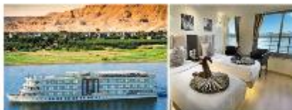
เรือสำราญแม่น้ำไนล์

** พักที่ Royal Beau Rivage Nile cruise 5* หรือเทียบเท่า **