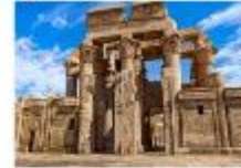
วิหารคอมมอมโบ