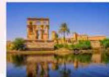
วิหารฟิเล

16.25 น. ออกเดินทางสู่กรุงไคโร สายการบิน Egypt Airlines เที่ยวบิน MS295