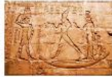
วิหารเอ็ดฟู