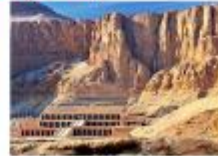
วิหารอ็คเซฟซุต