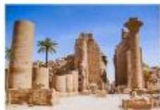
มหาวิหารคาร์นัค

xx.xx น. ออกเดินทางสู่เมืองลักซอร์ เที่ยวบิน... xx.xx น. เดินทางถึงสนามบินลักซอร์