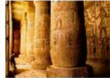
วิหารมาดินัตอาบู

** พักที่ Royal Beau Rivage Nile cruise 5* หรือเทียบเท่า **