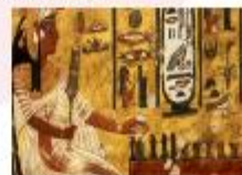
พิพิธภัณฑ์สถานแห่งชาติอียิปต์