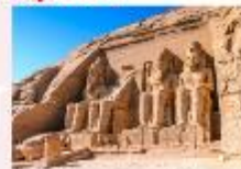
มหาวิหารอาบูซิมเบล

** พักที่ Royal Beau Rivage Nile cruise 5* หรือเทียบเท่า **