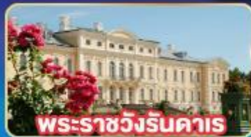
พระราชวังรินคาส