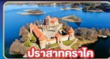
ปราสาทคราโด

พิเศษ! เกี่ยวเกือบครบทุกประเทศยุโรปเหนือ ลิทัวเนีย , ลัตเวีย , เอสโตเนีย , ฟินแลนด์