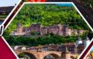
ไฮเดลเบิร์ก