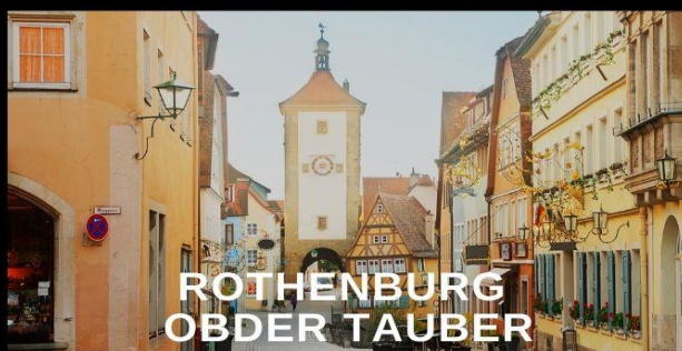
ROTHENBURG OBER TAUBER