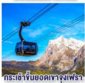
กระเช้าขึ้นยอดเขาจุงเฟรา