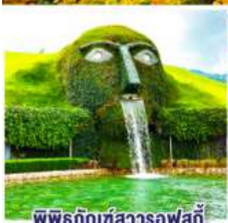
พิพิธภัณฑ์สวารอฟสกี

10- 16 มี.ค. 68 / 03-09 พ.ค. 68 10-16 มี.ย. 68