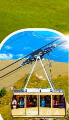
กระเช้าเซเคด้า