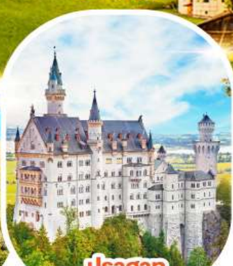
ปราสาท นอยชวานชไตน์