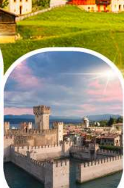
ซิริมิโอเน