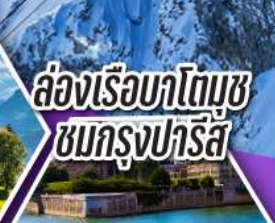
ล่องเรือบาโตมูซ ชมกรุงปารีส

เที่ยวเมืองวาอูซ เมืองหลวงของสาธารณรัฐ ลิกเทินสไตน์