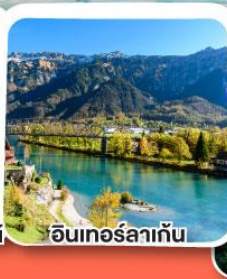
อินเทอร์ลาเก้น