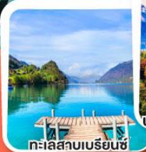
ทะเลสาบเบเรียนซ์