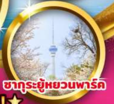
ชากระยู๋หยวนพาร์ค