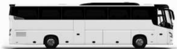
ตัวอย่างรถทัวร์ 1 ชั้น

ค่าที่พักตามที่ระบุในรายการหรือเทียบเท่าระดับเดียวกัน (ห้องพักละ 2 ท่าน) หากประเภทห้องพักท่านริเวสณาเกินจาก เช่น ริเวสคห้องพักเป็น TWIN BED หรือ DOUBLE BED ทางบริษัทขอสงวนสิทธิ์ในการปรับประเภทห้องพัก เป็น ตามที่โรงแรมมีอยู่ โดยไม่ต้องแจ้งให้ทราบล่วงหน้า