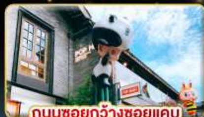
ถนนชอยกว้างชอยแคบ