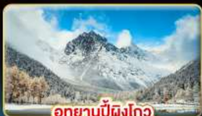
อุทยานปี้ผิงโกว