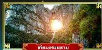
เทียนหมินซาน