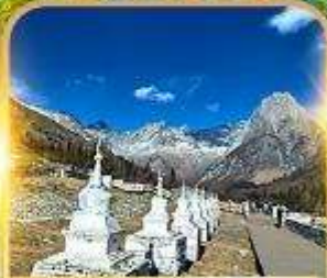
สวิตเซอร์แลนด์แดนมังกร