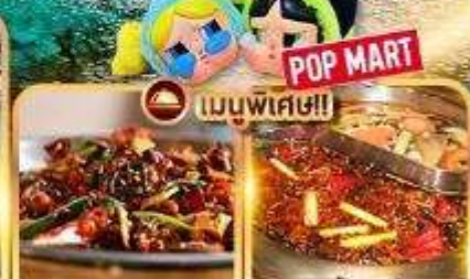
อาหารเสฉวน