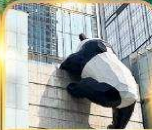
แพนด้าปิ่นตึก