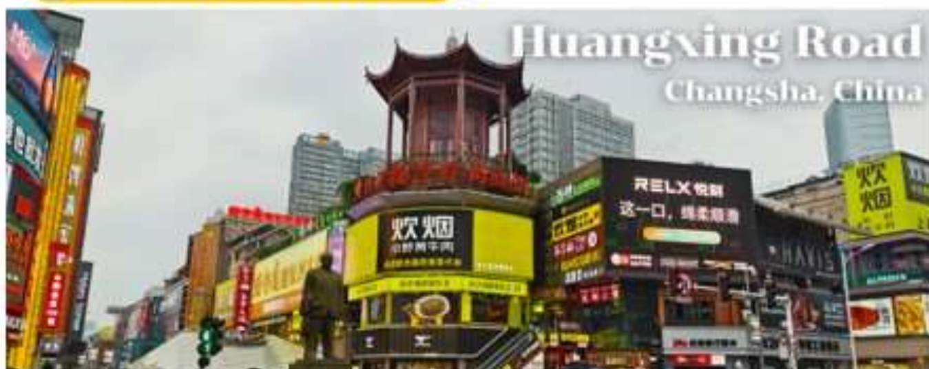
Huangxing Road Changsha, China

🕒 รับประทานอาหารเช้า นี้อที่ 13 # โรงแรม