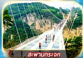
สะพานกระเจก