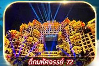
ตึกมหัศจรรย์ 72

เต็มอิ่มกับบรรยากาศเมืองโบราณเฟิ่งหวง เขาเทียนเหมินซาน ประตูสวรรค์ หมู่บ้านโบราณบนน้ำตกฟุรง