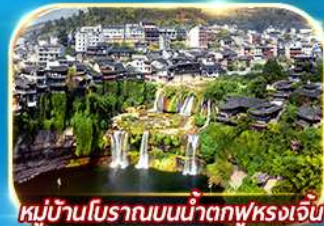
หมู่บ้านโบราณบนน้ำตกฟุรงเจิน