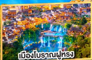
เมืองโบราณฟูหลง