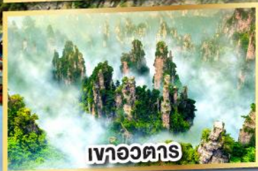
เขาอวดตาร