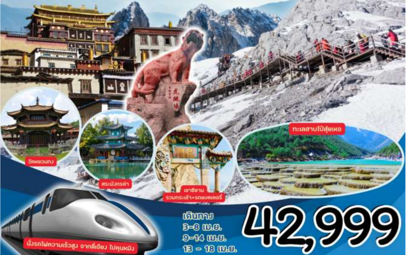
วัดผอมกวง