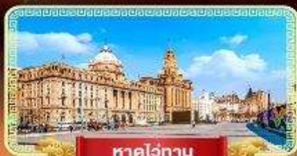
หาดวอทาน