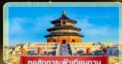
หอสังเกตการณ์เทียนถาน