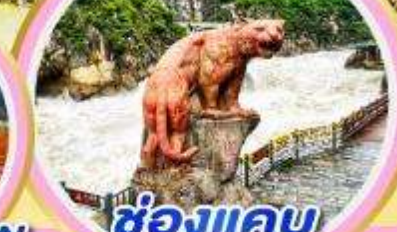
ช่องแคบ เสือกระโจน