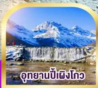
อุทยานปีศาจโกว