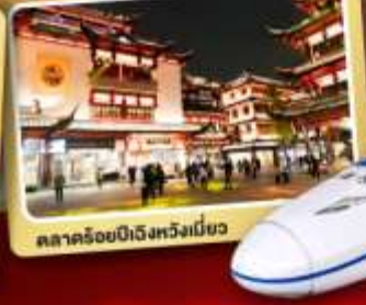
ตลาดร้อยปีเจิ้งหวงเหมียว