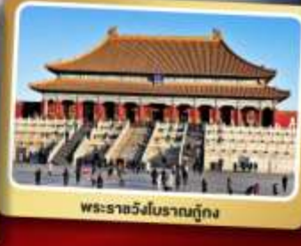
พระราชวังโบราณกู้กง