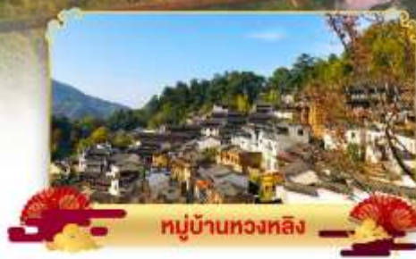
หมู่บ้านหวงหลิ่ง