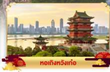
หอถังหวิ่งเก๋อ