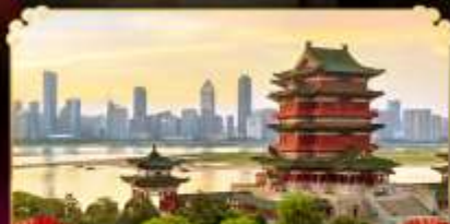
หอถึงหวังเก้อ