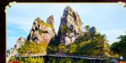
เจาซานซิงซาน