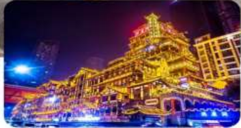
หลงหยาดิ่ง

เมนูพิเศษ สุกี้หม่าล่า บุฟเฟ่ต์ 6 วัน 5 คืน เดินทาง : ก.พ. – มี.ค. 68