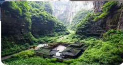
อุทยานหลุมข่อยฟ้า