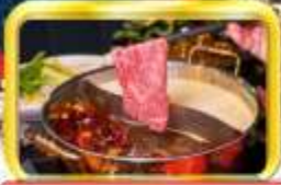
ชาบูหม่าล่า

เมืองดู ปี้เผิงโกว สีดรุณี สกีซีหลิงพักบนเขา