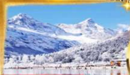
ปี้เผิงโกว