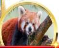
ศูนย์วิจัยหมีแพนด้า

ไฮไลท์!!! เที่ยว 2 อุทยาน 3 เขาพักบนเขาซีหลิง ช้อปปิ้งจุกๆ ถนนคนเดินจิ่งหลี่ ชุนซีลู่ ไท่กู่ลี POPMART เชคอินตึก IFS ย้อนยุคกลับไปเมืองโบราณดูเจียงเยียน พักดี 4-4+ ดาวตลอดการเดินทาง