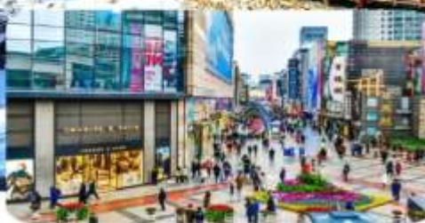
ถนนคนเดินชุนซีถู๋