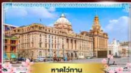
หาดไถ่ทาน

“ชมดอกซากุระนลิบบาน ณ แดนมังกร” ล่องเรือทะเลสาบตะวันตก ไข่มุกแห่งหางโจว