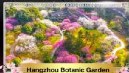
Hangzhou Botanic Garden