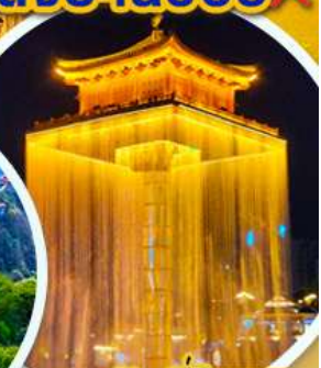
อุ้งน้ใจ

เมนูพิเศษ !! อิ่มอร่อยกับบุฟเฟ่ต์ชาบู และ ปิ้งย่าง พร้อมเครื่องดื่ม