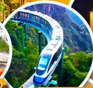
นั่งรถไฟริมพาว