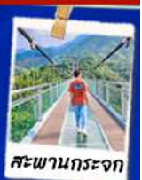
สะพานกระจก