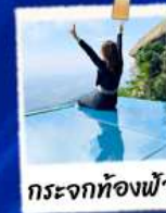
กระจกท้องฟ้า