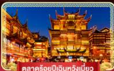
ตลาดร้อยปีเงินหวังเมี่ยว

เที่ยวมหานครสุดทันสมัย "เซี่ยงไฮ้" ถ่ายรูปเช็คอินที่เก๋ที่สุดปิง เมืองจีนฟิลลิปโป