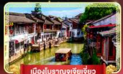
เมืองโบราณจูเจียเจี้ยว