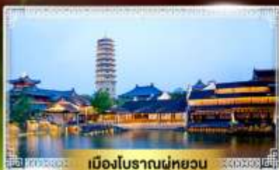
เมืองโบราณฝูหยวน