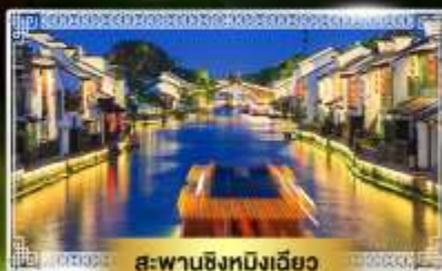
สะพานชิงหิงเฉียว