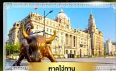
หาดว่อกาน