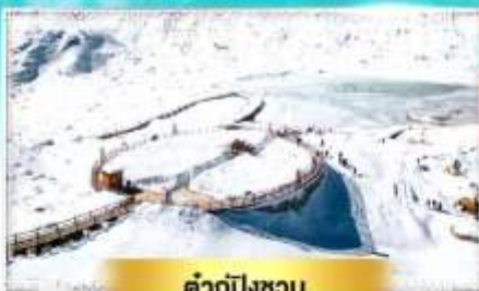
คำกู่ปิงชวน