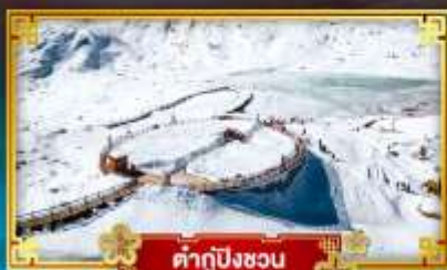
คำกู่ปิงชวณ

สัมผัสความหนาว เที่ยวจัดเต็ม “4 อุทยานสวรรค์”