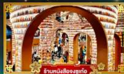
ร้านหนังสือจงชวเก้อ