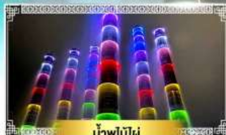
น้ำพุไม้ไผ่