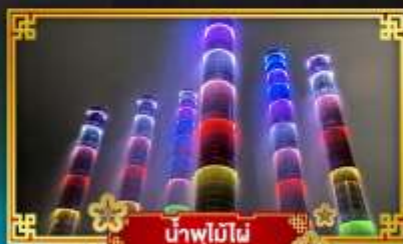
น้ำพุไม๊ผៃ