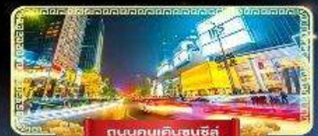
ถนนคนเดินชุนชิว