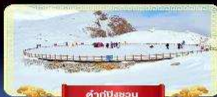
คำกู่ปิงชอน