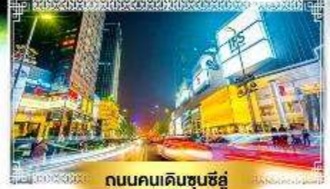
ถนนคนเดินชุนซีอู๋