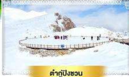
ต้ากู่ปิงชวอ