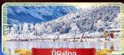
ปี้ดิงโกว

สัมปัสสวรรค์บนดินแห่งเมืองจีน เที่ยวสุดคุ้ม 3 อุทยานทางธรรมชาติ