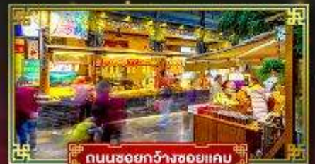
ถนนชอยกว้างชอยแคบ