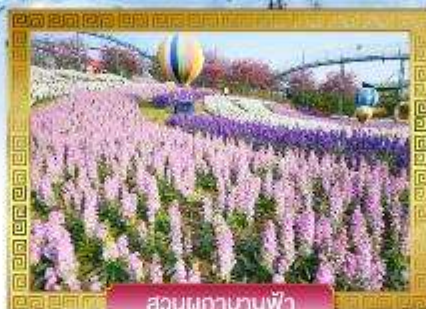
สวนผักกาดบานฟ้า