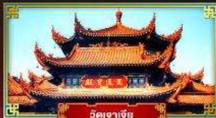
วัดเจาเจีย