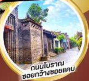
ถนนโบราณ ชอยกว้างชอยแคบ