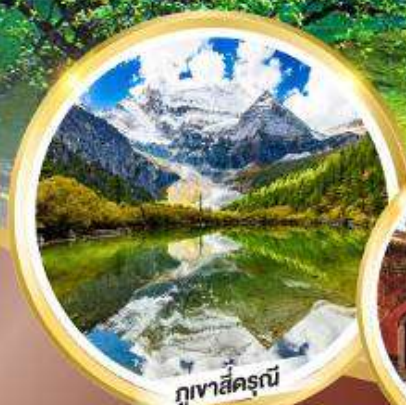
ภูเขาสีดรุณี