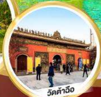
วัดต้าฉิว