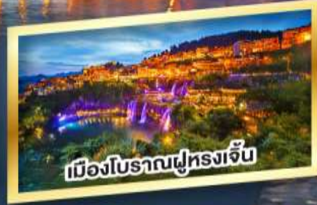
เมืองโบราณฟูหลงเจิ้น