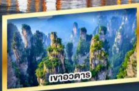
เขาอวตาร