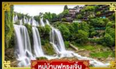
หมู่บ้านฟุทงเจี้ยน