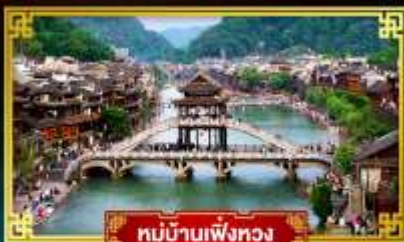
หมู่บ้านเฟิ่งหวง

★ สุดคุ้ม!! พักหรู 5 ดาว ทุกคืน ★ เที่ยว 2 เมืองโบราณแดนมังกร