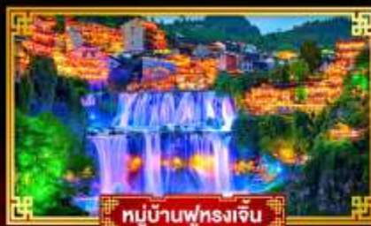
หมู่บ้านฟุหลงเจิ่น