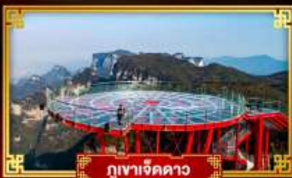
กุเขาเจ็ดดาว