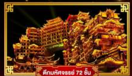
ตึกมหิศงธรย์ 72 ชั้น