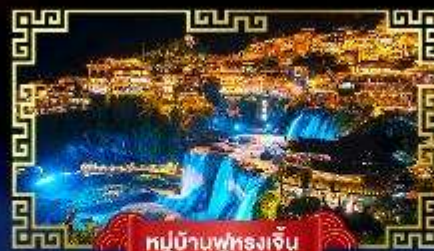
หมู่บ้านฟูหลงเจิน