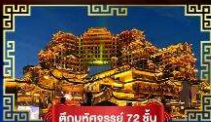
ตึกมหิตธรรม 72 ชั้น