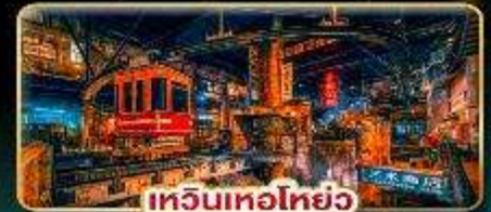
เทวินเทอโฮยอ