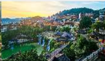
เมืองโบราณฟูหรงเจิน