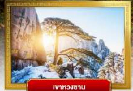
เขาหวงซาน