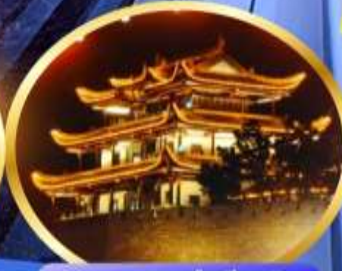
หอคอยทองคำเทียนซัน