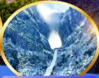
ประตูล่องเรือ เขียนหมื่นซวน