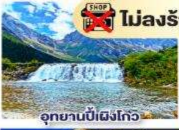
อุทยานปีฝั่งโกว