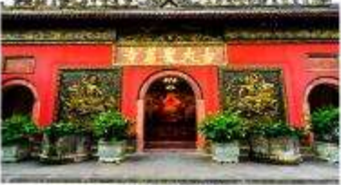
วัดต้าเจี๊ว