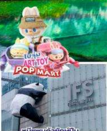
หมีแพนด้ายักษ์ปีน ตึกถนนชุนซีตู้