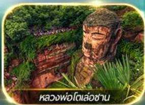
หลวงพ่อดิลอ่ชาน