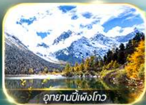
อุทยานบิ๋นเฟิงโกว