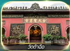
วัดต้าจื่อ