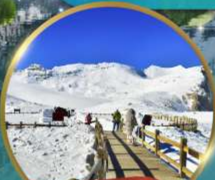
ต่ากู่กลาเซียร์