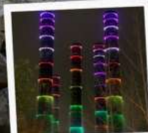
แสงสี ห้าง SKP