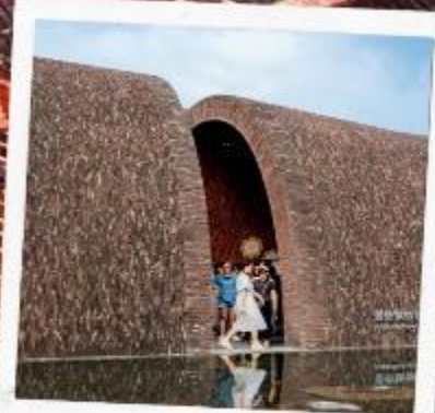
จิ่งเต๋อเจิน